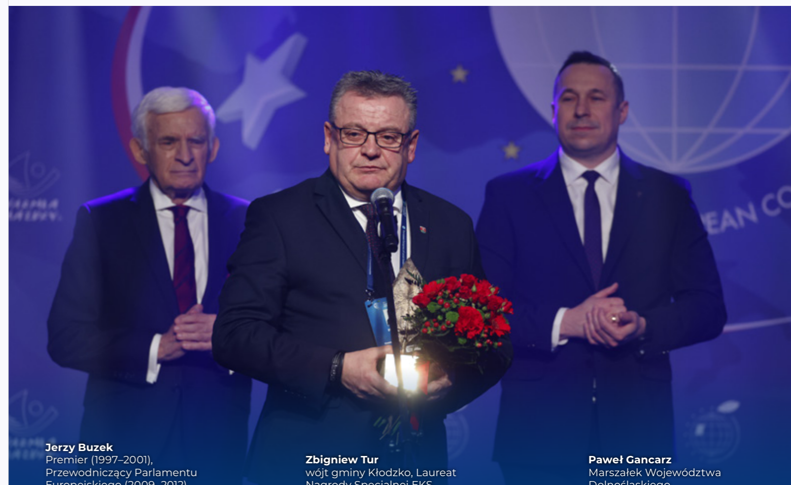
Jerzy Buzek Premier (1997–2001), Przewodniczący Parlamentu Europejskiego (2009–2012)