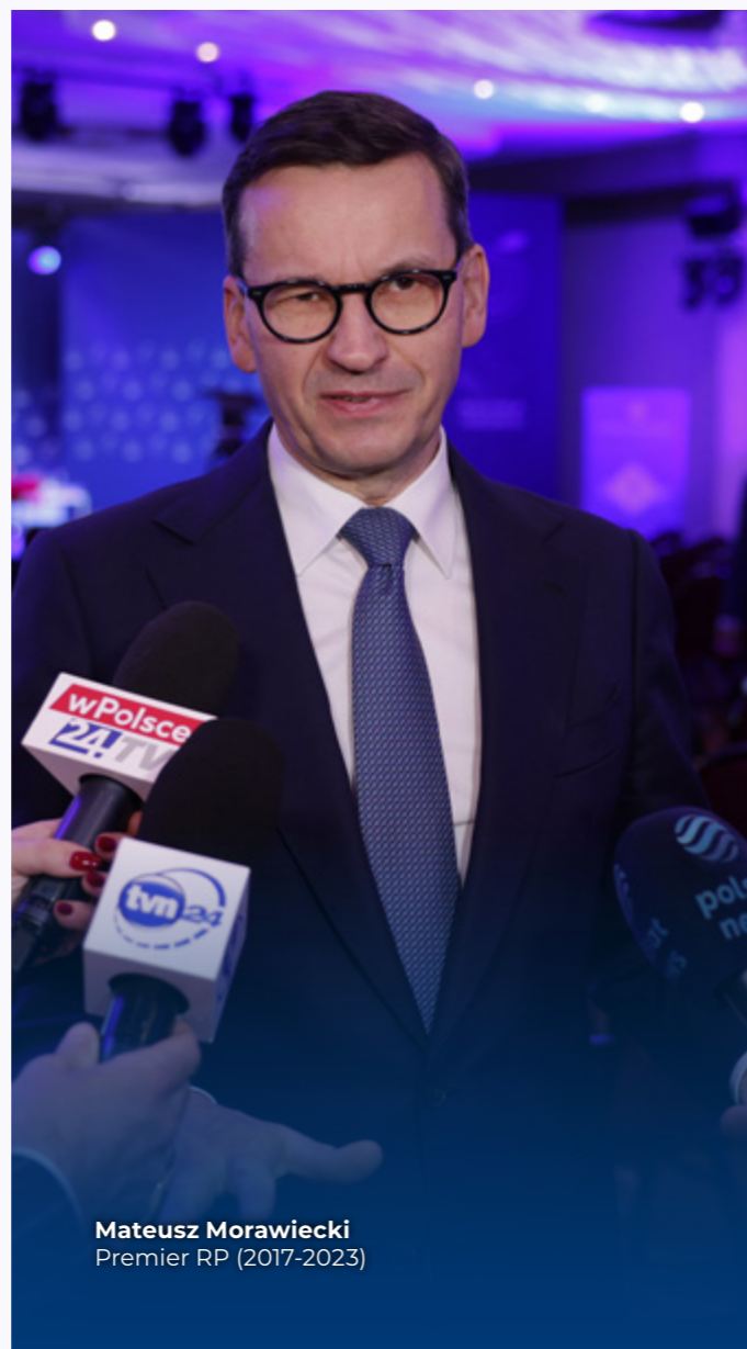
Mateusz Morawiecki Premier RP (2017-2023)

Europejski Kongres Samorządów odbił się szerokim echem w mediach. Jego obrady relacjonowali przedstawiciele 72 redakcji z Polski i zagranicy, w tym wszystkich najważniejszych w naszym kraju jak m.in. TVP, TVP INFO, Polsat News, Telewizja Republika, TVN24, Rzeczpospolita, Polska Agencja Prasowa, Dziennik Gazeta Prawna, Polskie Radio. W tym roku partnerami kongresu było 58 tytułów prasowych, redakcji telewizyjnych, radiowych i internetowych. EKS był także jednym z najczęściej komentowanych tematów na Twitterze i LinkedIn, co pokazuje rosnące zainteresowanie debatą na temat przyszłości samorządów.