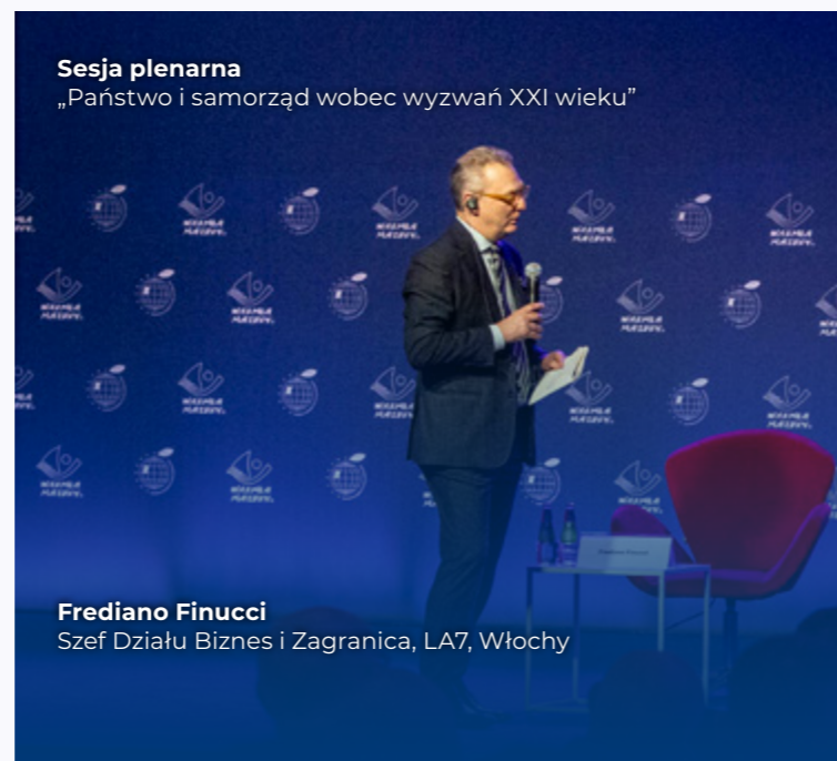
Sesja plenarna „Państwo i samorząd wobec wyzwań XXI wieku”