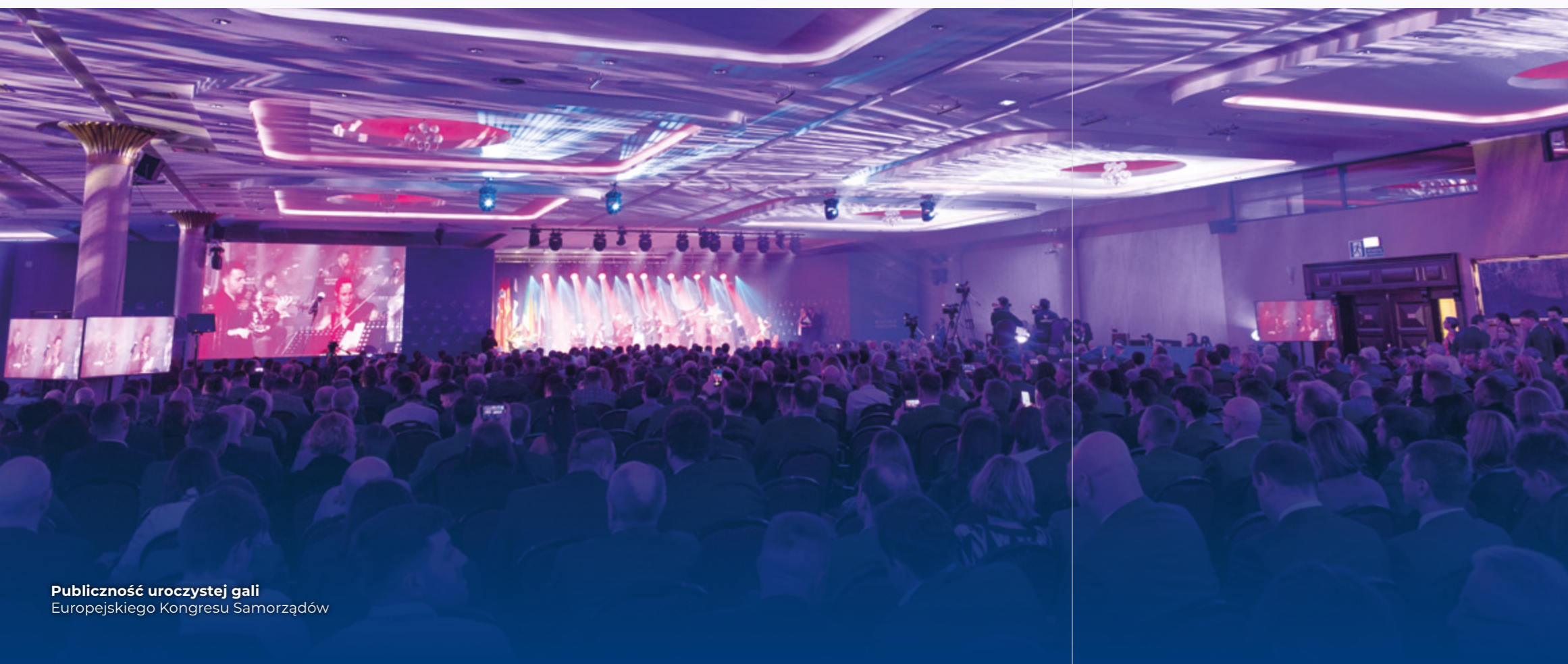
Publicność uroczystej gali Europejskiego Kongresu Samorządów