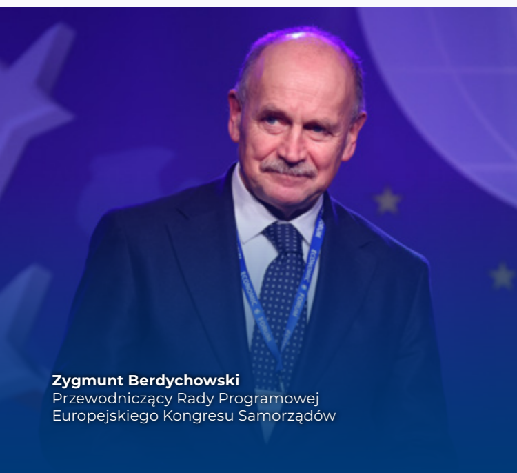
Zygmunt Berdychowski Przewodniczący Rady Programowej Europejskiego Kongresu Samorządów