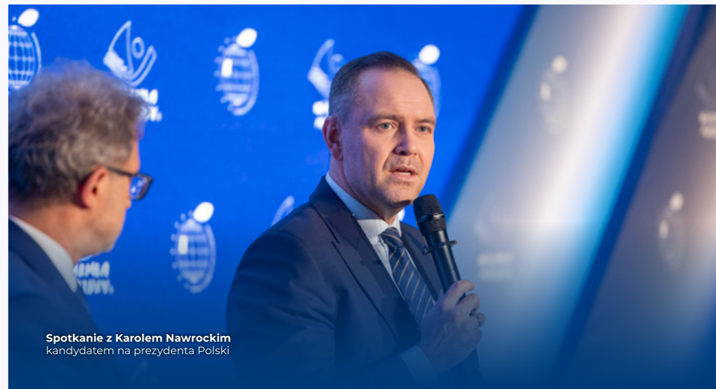
Spotkanie z Karolem Nawrockim kandydatem na prezydenta Polski

Bardzo istotnym elementem tegorocznego spotkania był duży udział przedstawicieli świata nauki.