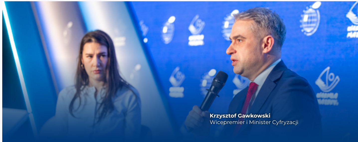
Krzysztof Gawkowski Wicepremier i Minister Cyfryzacji

Cieszy nas jeszcze większe zainteresowanie sprawami samorządowymi i społeczności lokalnych ze strony biznesu, ponieważ na współtworzenie naszego wydarzenia zdecydowało się w tym roku o 35% więcej partnerów biznesowych.