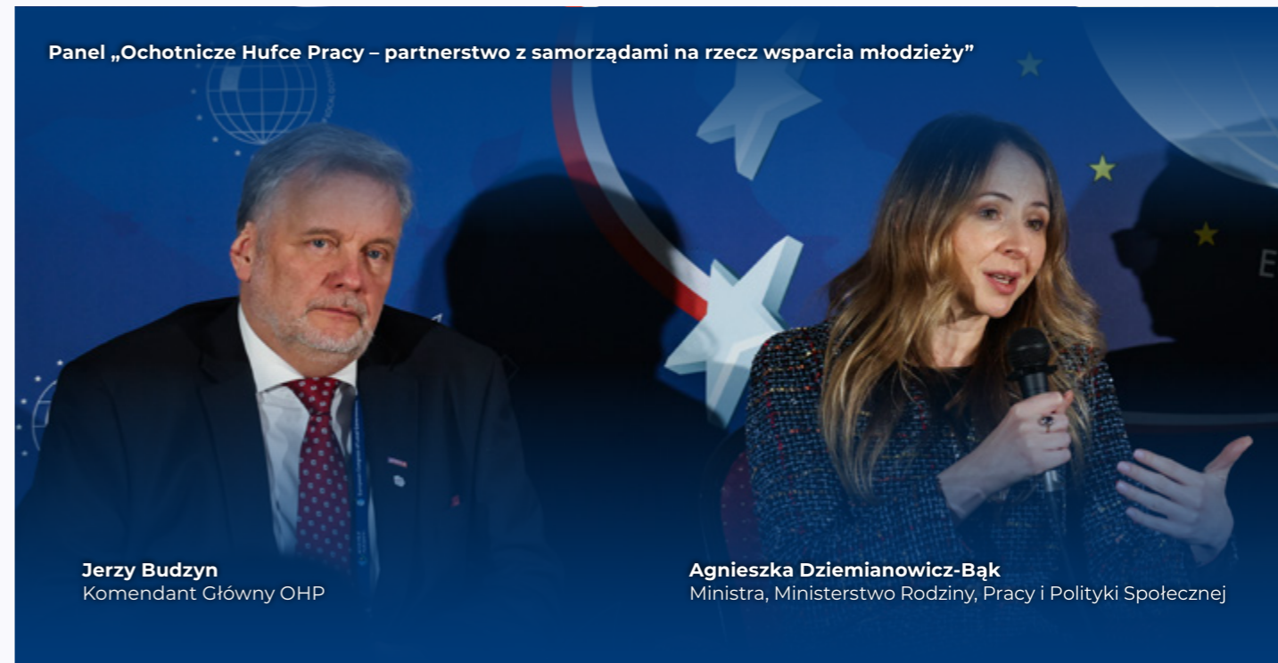
Panel „Ochotnicze Hufce Pracy – partnerstwo z samorządami na rzecz wsparcia młodzieży”

Wiceburmistrz Okręgu Nordland w Norwegii i Wiceprzewodnicząca Zgromadzenia Regionów Europy, Europejski Samorządowiec Roku 2024