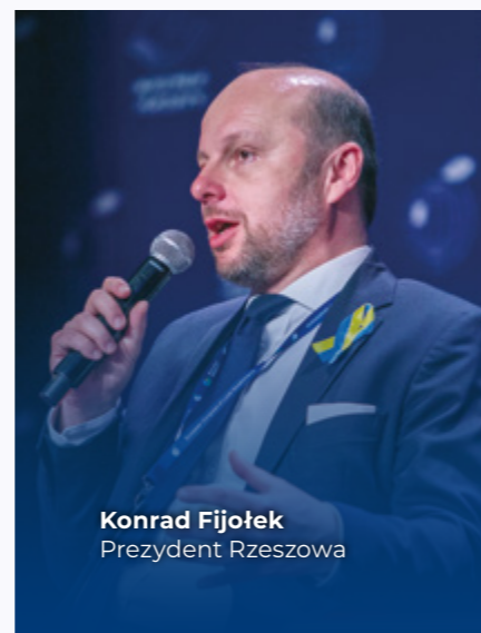
Konrad Fijołek Prezydent Rzeszowa