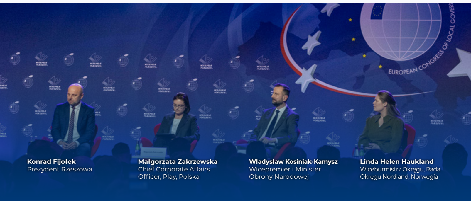
Konrad Fijołek Prezydent Rzeszowa