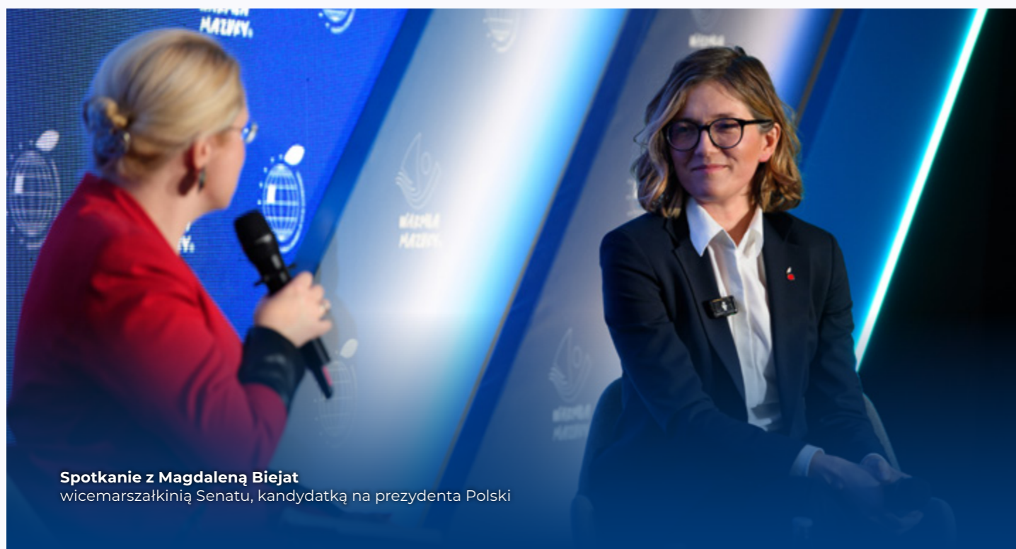
Spotkanie z Magdaleną Biejat wicemarszałkinią Senatu, kandydatką na prezydenta Polski

Warto podkreślić, że wydarzenie stanowiło platformę między samorządem, instytucjami centralnymi, biznesem, naukowcami i NGO-sami a uczestnicy aktywnie wymieniali doświadczenia i nawiązywali współpracę, która zaowocuje nowymi projektami na poziomie lokalnym, krajowym i międzynarodowym.