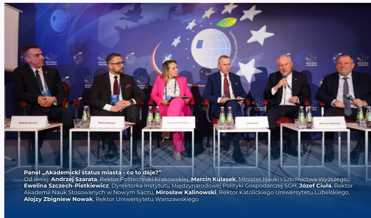
Panel „Akademicki status miasta - co to daje?”

Wzrost liczby uczestników, partnerów oraz międzynarodowych delegacji jest najlepszym dowodem na to, że wydarzenie to spełnia swoją misję. Już teraz zapraszamy na XI Europejski Kongres Samorządów w 2026 roku, który będzie kolejną okazją do wymiany doświadczeń, inspiracji i budowania silniejszych samorządów w Europie.